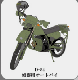
D-54 偵察用オートバイ