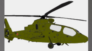
D-19 観測ヘリコプター “ニンジャ”