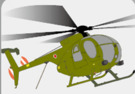
D-20 観測ヘリコプター “カイユース”