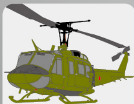
D-21 多用途ヘリコプター “ヒューイ”