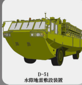
D-51 水際地雷敷設装置