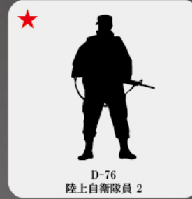
D-76 陸上自衛隊員 2