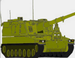
D-28 99式自走155mmりゅう弾砲