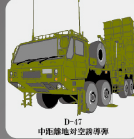
D-47 中距離地对空誘導弾