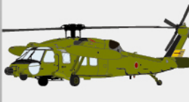
D-22 多用途ヘリコプター “ブラックホーク”