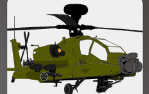
D-14 対戦車ヘリコプター “アパッチ”