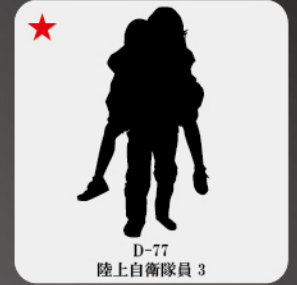
D-77 陸上自衛隊員 3