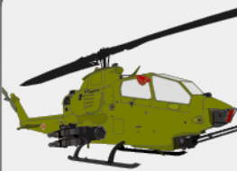
D-13 対戦車ヘリコプター “コブラ”