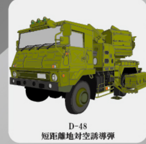
D-48 短距離地对空誘導弾