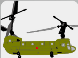
D-15 輸送ヘリコプター “チヌーク”