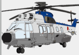
D-16 大型輸送ヘリコプター