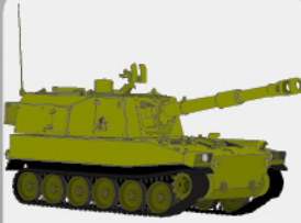
D-27 75式自走155mmりゅう弾砲