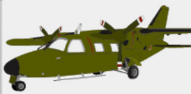
D-17 連絡偵察機 “LR-1”