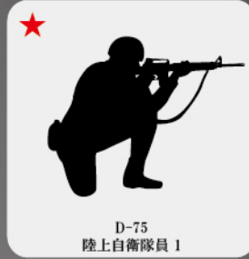
D-75 陸上自衛隊員 1