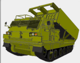
D-32 多連装ロケットシステム 自走発射機